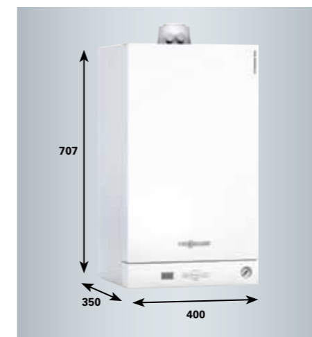
Ideal para la zona habitable por sus dimensiones reducidas y un mínimo nivel sonoro.