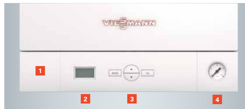
Regulación con sistema de diagnóstico integrado